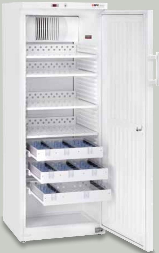
Abb.: MediKS 360 mit 3 Schüben und 4 Rostböden – Art. Nr. KS-100.029

BPV Medikamentenkühlschrank nach DIN 58345 mit Liebherr-Kühlsystem