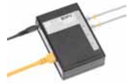
Dokumentations- u. Monitoring-Lösungen