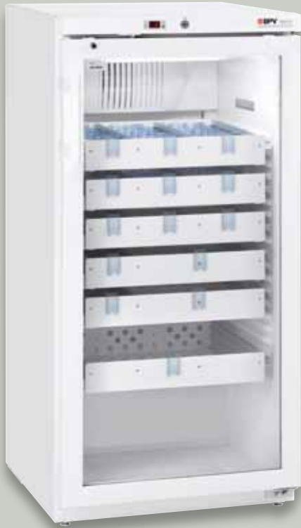
Abb.: MediKS 260 mit 6 Schüben und ISO-Glastür - Art. Nr. KS-100.023

BPV Medikamentenkühlschrank nach DIN 58345 mit Liebherr-Kühlsystem